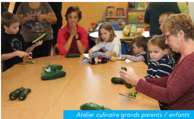
Atelier culinaire grands parents / enfants