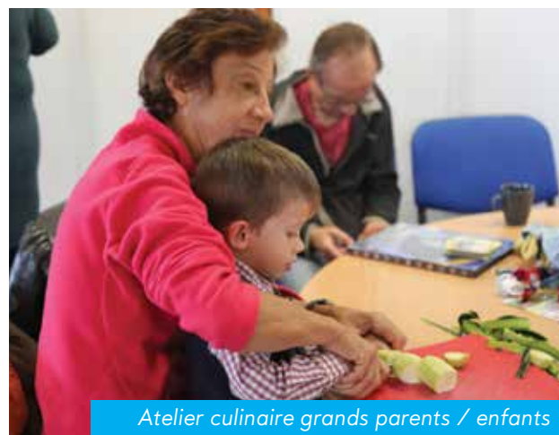
Atelier culinaire grands parents / enfants