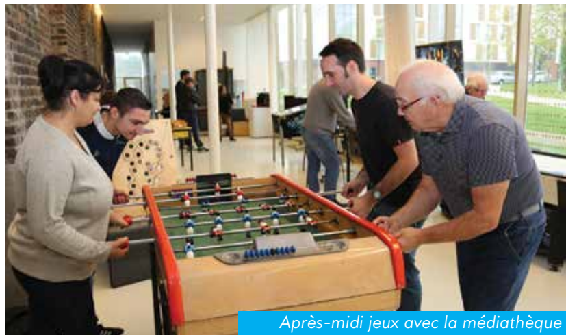
Après-midi jeux avec la médiathèque

A travers leur délégation respective (CCAS, culture, éducation, jeunesse), les élus fresnois se sont mobilisés pour que ce mois d'actions proposé par le CCAS, le Centre socioculturel et les associations fresnoises soit un véritable succès. Retour en images sur cette semaine nationale consacrée aux seniors et qui, à Fresnes, a duré pas loin d'un mois.