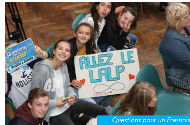
Questions pour un Fresnois