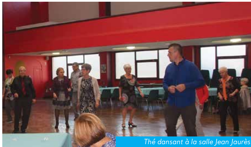
Thé dansant à la salle Jean Jaurès