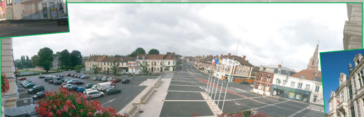
Le Centre Ville