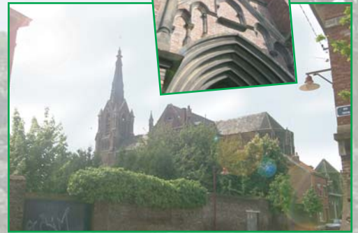
L'Eglise du Centre

Tout a changé; les mentalités ont évolué et la région aspire même à la reconnaissance de ce patrimoine grâce la mission Bassin Minier UNESCO. Si l'on repose la question "qu'a le Nord à offrir ?" aujourd'hui, la réponse reste difficile, mais cette fois à cause de la diversité des réponses possibles.