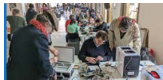
NUMÉRIQUE - BRÈVES P 20-21