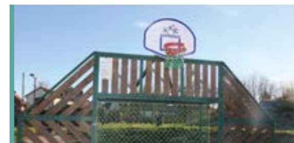
BUDGET 2022 P 6-7