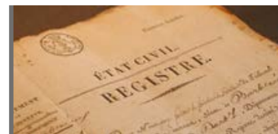
ÉTAT-CIVIL P 22-23