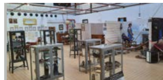
HÔTEL DE VIE P 16-17