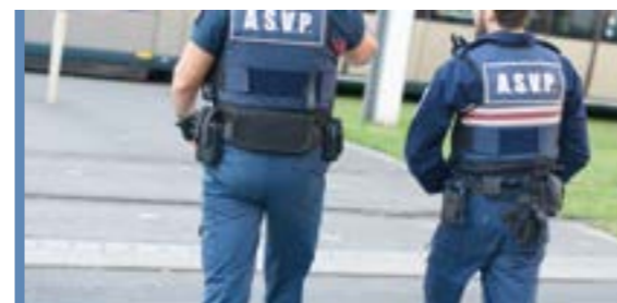
TRANQUILLITÉ PUBLIQUE P 8-9