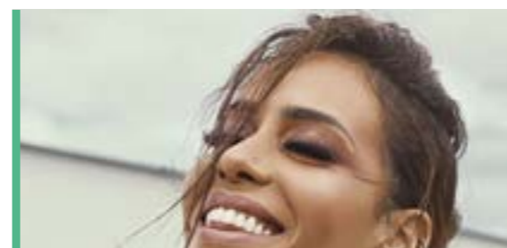
ÉVÉNEMENTS P 12-13