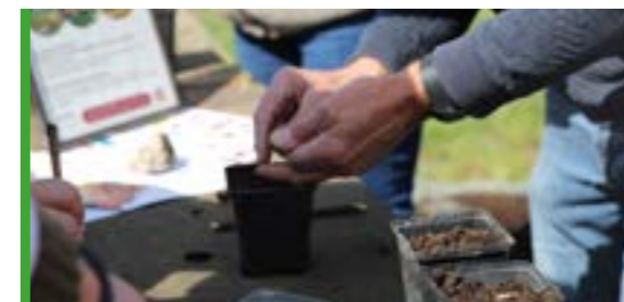
ENVIRONNEMENT P 10-11