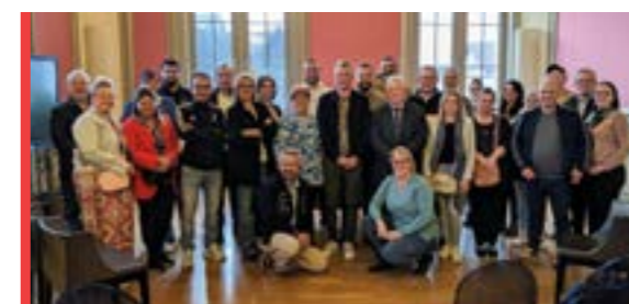
COMMERCE P 14-15